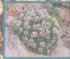
Sarcocapnos saetabensis Orelleta de roca Zapaletos de la virgen