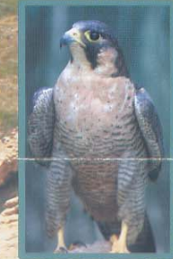
Falco peregrinus Falcó comú Halcón peregrino