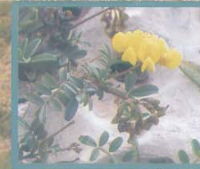
Hippocrepis valentina Ferradura valenciana Hierba de la herradura