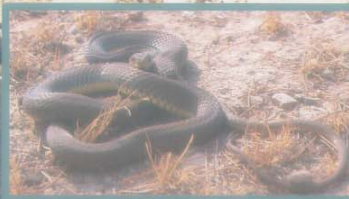
Malpolon monspessulanus Serp verda Culebra bastarda